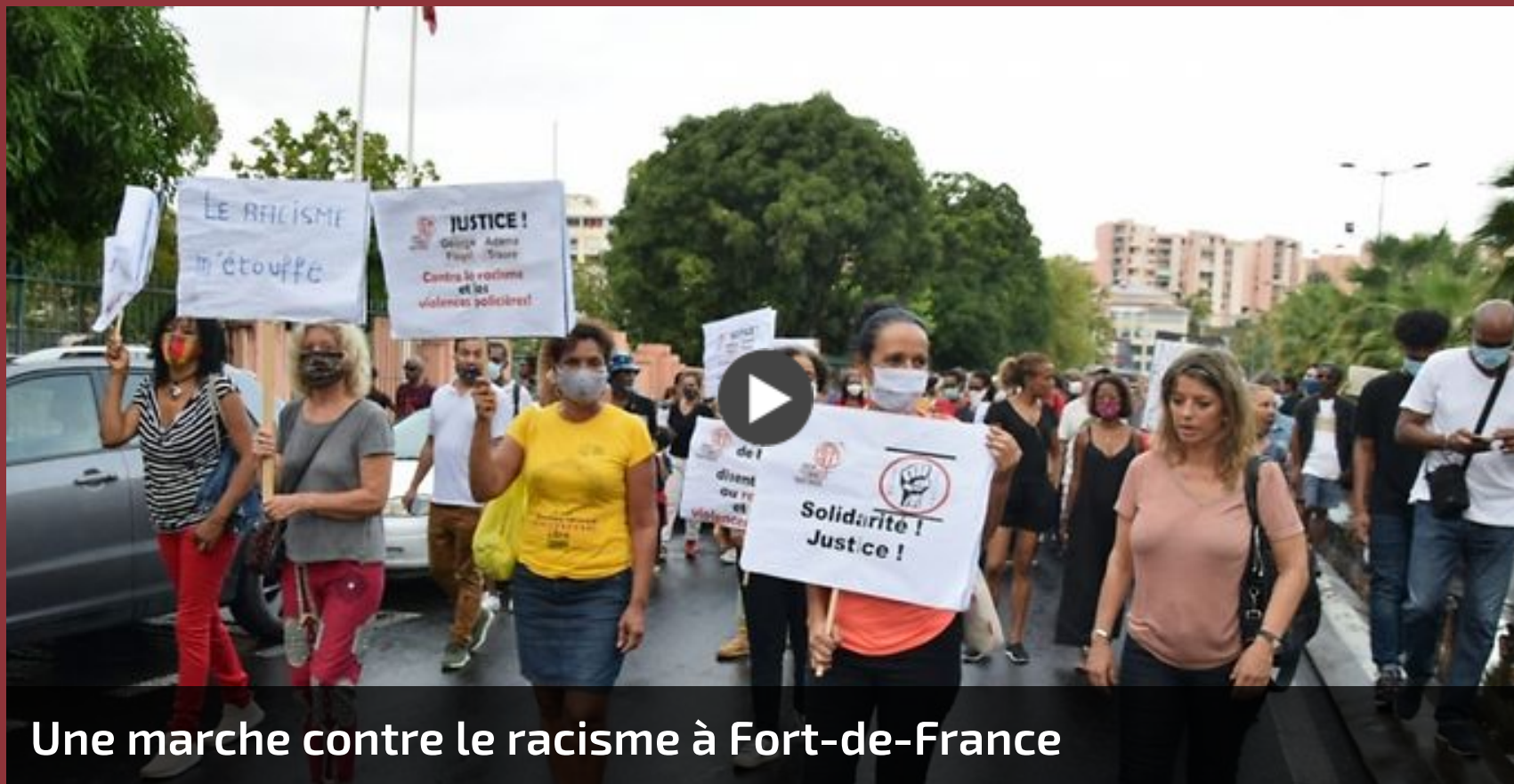
Une marche contre le racisme à Fort-de-France